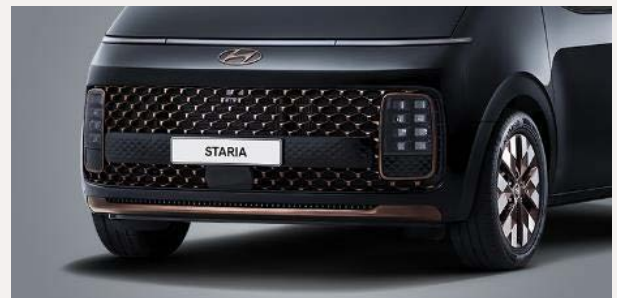
Luxury 7 személyes