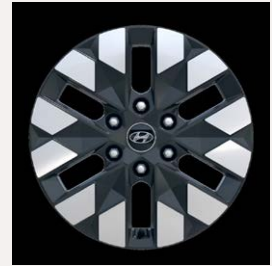
18" könnyűfém keréktárcsák (Luxury 7 személyes)