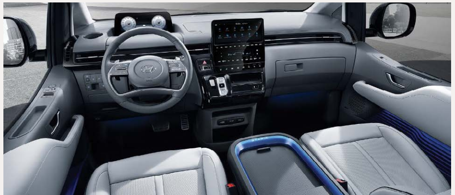
Luxury 7 személyes