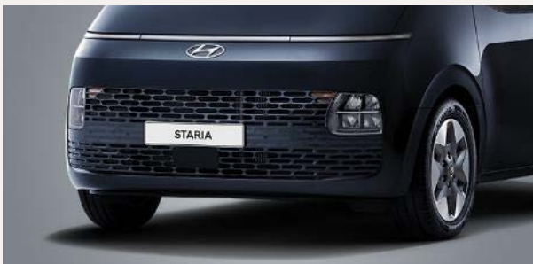
Comfort 9 személyes