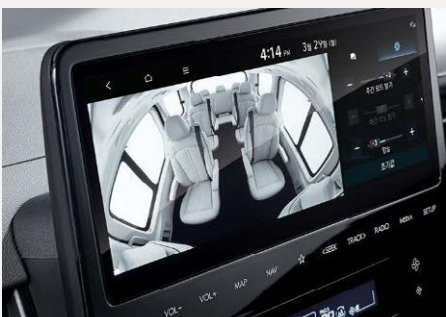
Audióvizuális kapcsolattartás a hátsó utasokkal