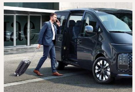
Elektromosan csúsztható ajtók