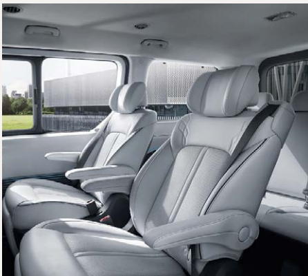
Luxury 7 személyes