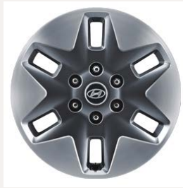
18" könnyűfém keréktárcsák (Comfort Plus 9 személyes)