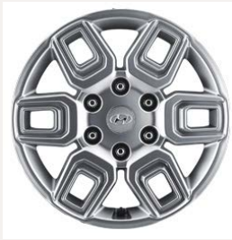
17" könnyűfém keréktárcsák (Comfort 9 személyes)