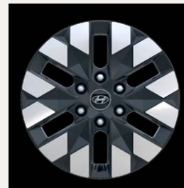
18" könnyűfém keréktárcsák (Luxury 7 személyes)