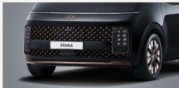
Luxury 7 személyes