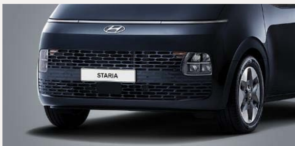
Comfort 9 személyes