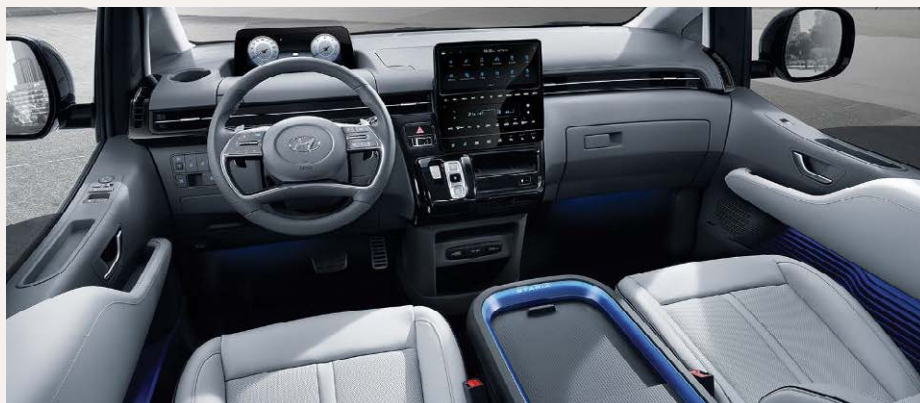
Luxury 7 személyes