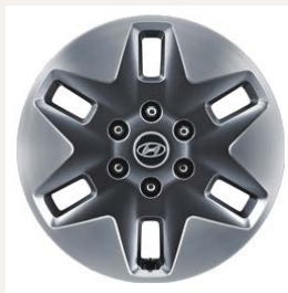
18" könnyűfém keréktárcsák (Comfort Plus 9 személyes)