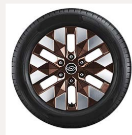
18" könnyűfém keréktárcsák (Luxury 7 személyes)